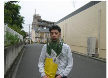
葱配達中のメンバー

ご近所のうどん屋の「心屋」さんが買って下さることになり、週2回来夢のメンバーが5束ずつ配達しています。「心屋」さんの美味しいうどんがより一層美味しくなるような柔らかい葱を目指します。